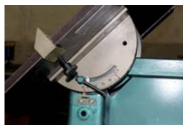
Узел поворота стола