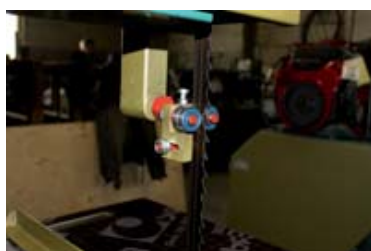
Направляющие ленточной пилы

При соответствующем подборе ленточной пилы на этих станках можно распиливать широкую гамму материалов: различные пластики, резину, рулонные материалы, ячеистые бетоны и другие материалы, включая цветные и черные металлы.